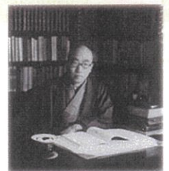
江戸川乱歩

没後60年を迎える谷崎と乱歩。大正期に数多くの探偵小説を創作した谷崎と、それらの作品を読み、影響を受けて作家となった乱歩。二人の影響関係を紐解きます。