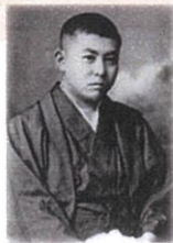
文壇デビュー頃の谷崎