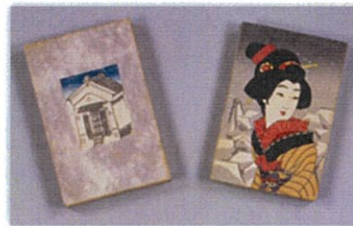
『お艶殺し』初版本 大正4(1915)年刊

凝りに凝った谷崎作品初版本の数々について、それぞれにまつわるエピソードを添えて、学芸員がわかりやすく解説します。