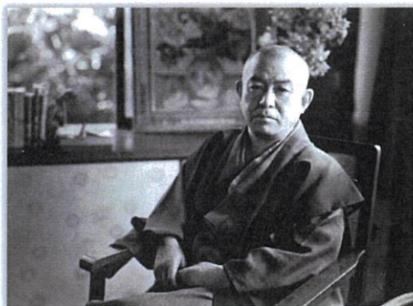
昭和24(1949)年頃 自宅応接室にて

谷崎潤一郎は明治19(1886)年東京に生まれ、20代半ばで文壇にデビューします。以後、昭和40(1965)年に生涯を閉じるまで約半世紀にわたり、激動の社会情勢に流されることなく独自の世界を描き続けました。その潤一郎の人物と作品を、生い立ちから晩年にわたって紹介します。