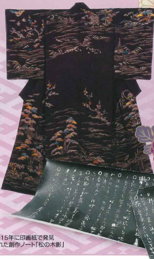
松子愛用の訪問着