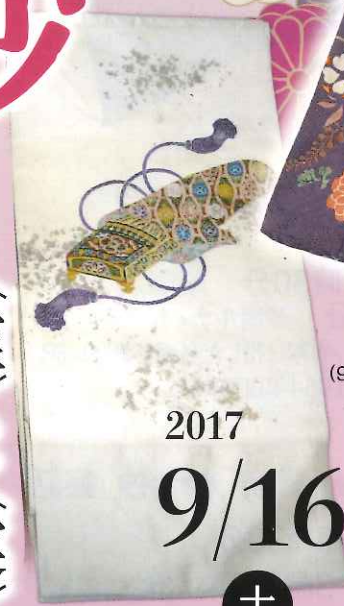
▲大阪の老舗薬種商の子女が着た振袖(9月16日~10月29日展示、大阪歴史博物館所蔵)