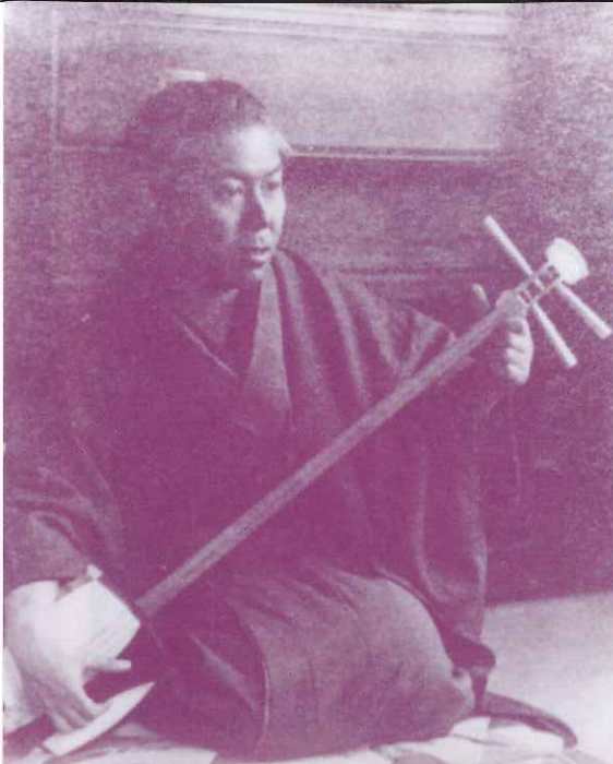
三味線を稽古する昭和初期の谷崎潤一郎(兵庫県岡本梅ヶ谷の自宅で)